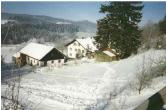
Der Simmerlhof im Winter